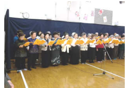
▲はつらつ歌声講座

写真申込をされた方へ 写真の現像ができましたので窓口にてお渡し出来ます。たくさんのお申込みありがとうございました☆