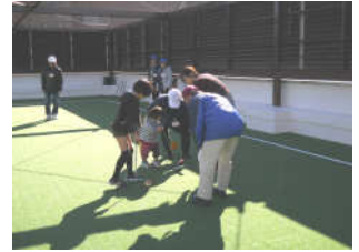
▲ゲートボール体験コーナー