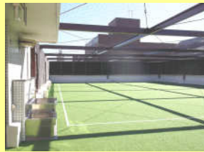
新しくなった図書室（左）と屋上（右）

10月から一ヶ月に渡る工事が無事終わり、図書館のカーペットと屋上の人工芝が新しくリニューアルされました。ふかふかのカーペットと新しい人工芝を見に、ぜひご来館下さい。