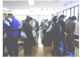
▲掘り出し市の様子

11月19日（日）皆さまの絶大なるご協力で、無事秋まつりを終える事ができました。当館・平野児童館合わせて923名の来館があり、たくさんの方にお出で下さった事を感謝しております。催し物やイベントブースなどを始め各コーナーで賑わいを見せていました。中でも掘り出し市（バザー）は今回も凄まじい勢いで、圧倒されっぱなしでした。今回は屋上でゲートボール体験コーナーも開催。様々な世代の交流の場になったことと思います。今回の大規模なお祭りはボランティアの方々のご協力がなければ成立しなかったと思います。この場を借りて…本当にありがとうございました！