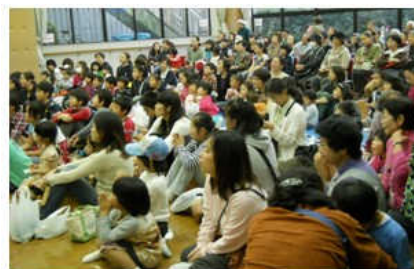
▲ドキドキ感を味わえた大抽選会

当館・平野児童館合わせて1223名の来館があり、たくさんの方にお出で下さった事を感謝しております。 掘り出し市やイベントブースを始め、体育室で行った数々の催しも大盛況でした。大抽選会(写真)では子ども達を中心にヒートアップしてました(笑)今回の大規模なお祭りはボランティアの方々のご協力がなければ成立しなかったと思います。この場を借りて・・・本当にありがとうございました!